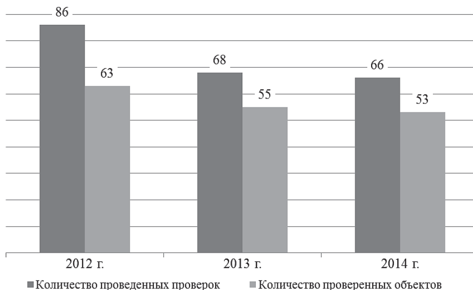
Количество проверенных объектов и проведенных проверок за 2012–2014 годы

Анализируя тематику проведенных проверок, можно отметить, что преобладающими направлениями контрольных мероприятий являлись вопросы использования средств областного бюджета в социальной сфере, сфере образования, сельском хозяйстве, на строительство социально значимых объектов, использование межбюджетных трансфертов.